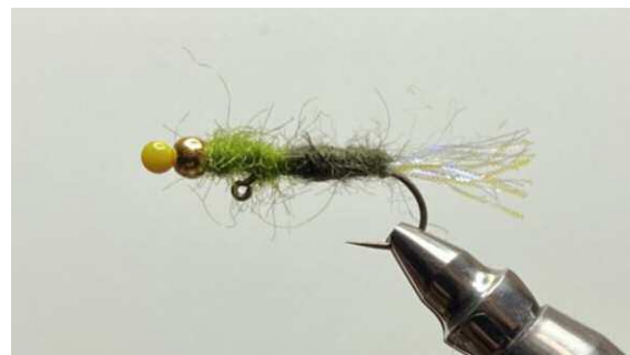
Het uiteindelijke resultaat