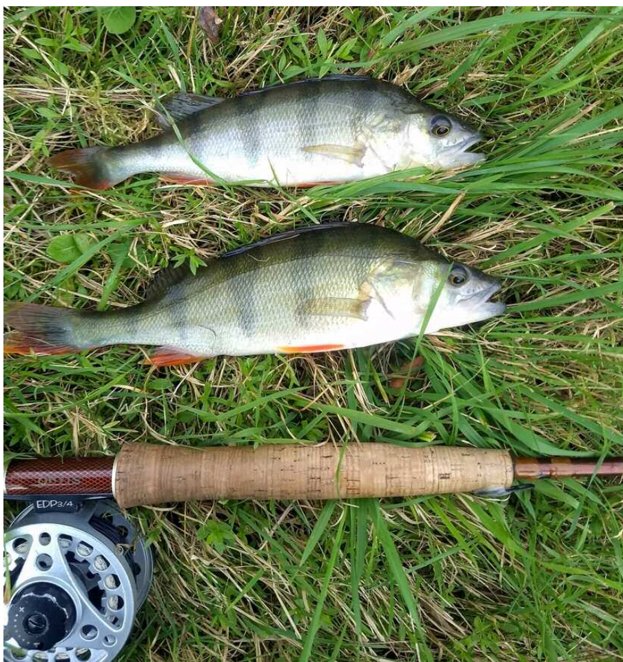
Doublet gevangen met de FBI-RIG.