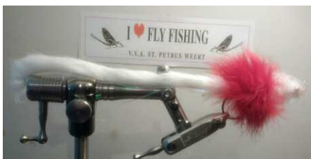
Sfeerimpressie van de bindavond snoekstreamer, "red-head"