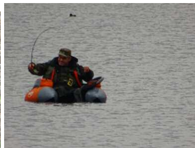
Van de kant en op het water.