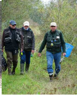
Een aantal kiest ervoor om vanaf de kant te vissen.