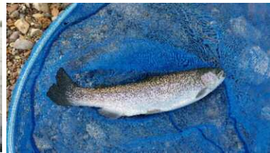
En vis is er gevangen.