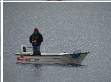
Snel ging iedereen weer het water op.